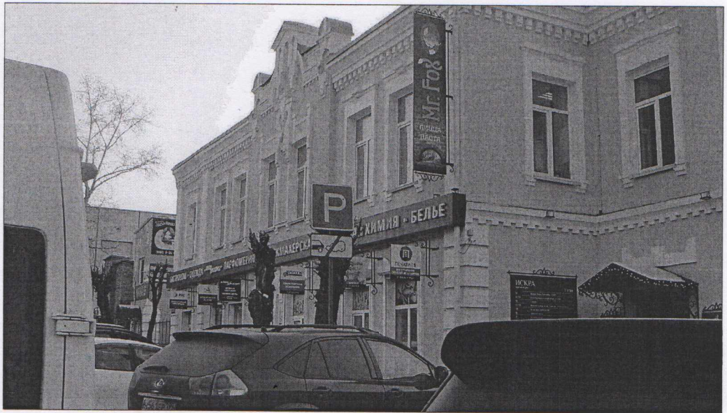
Фото 3 Вид с севера на главный северо-восточный и боковой северо-западный фасады.