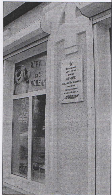
Фото 5. Мемориальная доска с надписью «В этом здании в 1915-1916 гг. работал Фрунзе Михаил Васильевич советский государственный и военный деятель».