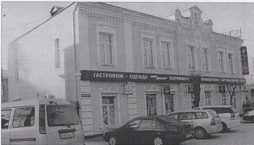
Фото 1. Вид с востока на главный северо-восточный фасад.

Фотографическое изображение объекта (на момент утверждения охранного обязательства): «Дом жилой Старновского», г. Чита, ул. Костюшко-Григоровича, 23