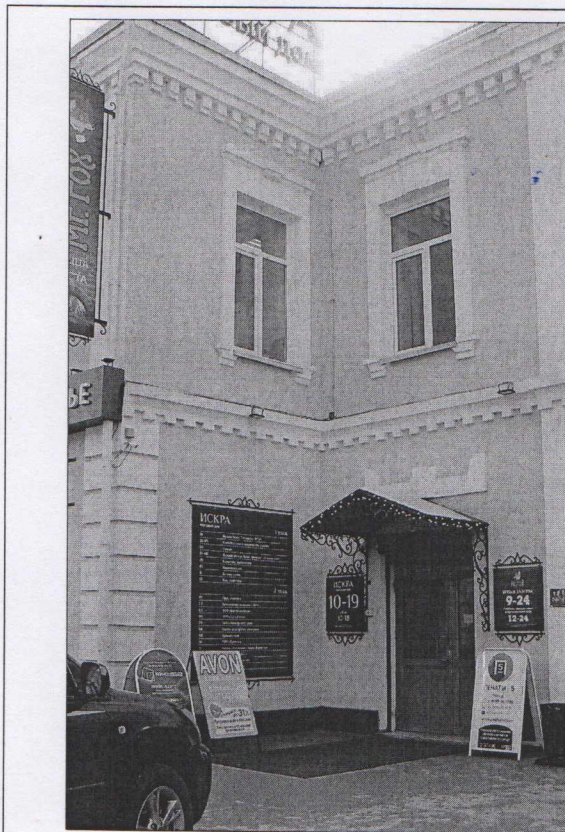
Фото 4. Парадный вход на главном северо-восточном фасаде.