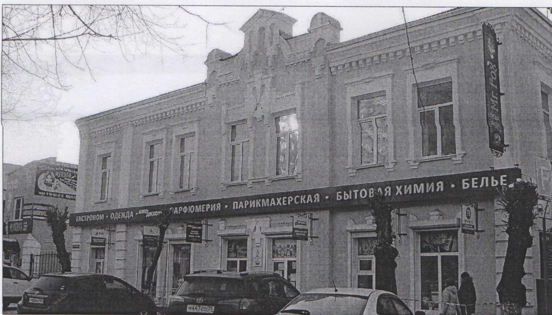
Фото 2. Вид с севера на главный северо-восточный фасад.